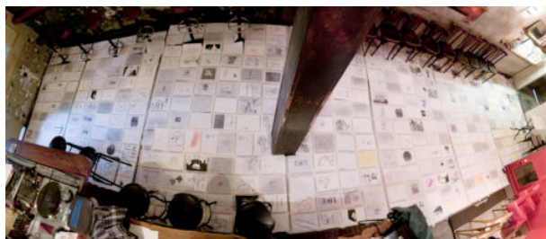
Elefants, Sabates i Papers

No era la primera vegada que em passava. L'obra de'n Fran ja m'havia inquietat abans, especialment quan va fer l'exposició "Elefants, sabates i paper" iii . Allà vaig fullejar per primera vegada les seves llibretes: publicacions de butxaca que penjaven del sostre amb pàgines en les quals personatges somrients, repetitius, anònims, habitaven l'entorn de paper rodejats del que semblaven notes quotidianes. Llibretes que podien ser agendes que podien ser diaris que podien ser blocs d'esbossos, que podien ser catàlegs. De fet, des d'aquell primer contacte amb l'obra de l'artista, han estat poques les vegades en què la paraula inquietud no s'ha passejat pel meu voltant, rodejant-me com un gat de mirada seductora i mai directa, mai transparent, un personatge estrany, fantasmagòric, de presència constant iv . Va ser encara millor quan vaig saber que, en certa manera, és una sensació buscada per l'artista, que en un moment donat d'aquella visita em va parlar del seu desig de fer imatges estranyes. La recerca de l'imatge més rara que pugui haver-hi. Desig que, per com l'anomena, per com el posa en paraules, em recorda al d'un altre cineasta, en aquest cas l'alemany Werner Herzog, parlant no pas de raresa, sinó de transparència.