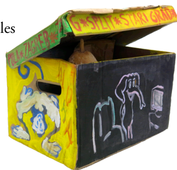
This Was Forever Until Now 11 boxes with different sizes Mixed materials 2015

En una visita al seu estudi de Calonge, en Fran em fa un recorregut per les seves obres, pels seus mètodes de treball, els seus espais, ritmes i trànsits. Allà surten algunes paraules en les quals l'artista troba el suport de la seva narració. O potser sóc jo, que en escoltar-lo, retinc als meus apunts uns mots concrets que m'ajuden a explicar-me a mi mateixa què és el que l'artista fa i a apuntalar les meves pròpies impressions.