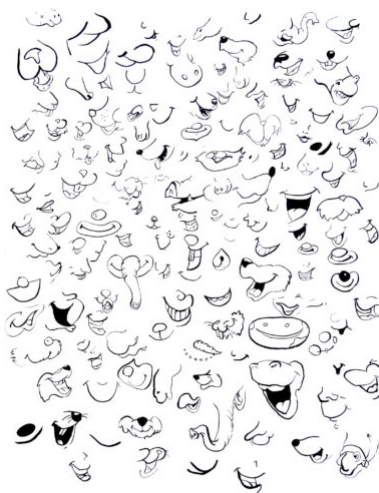
Ja - Je - Ji - Jo - Ju - Jo - Ji - Je - Ja 100 x 75 cm. ink on paper 2015

(...) la realidad vista y oída en su acaecer siempre es en tiempo presente. El tiempo del plano-secuencia, entendido como elemento esquemático y primordial del cine –o sea, como una subjetiva infinita- es, así, el presente. i